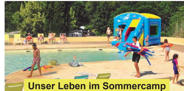
Unser Leben im Sommercamp

Für unsere Werkstätten, Aktionen und Abendprogramme gibt es mehrere große Gemeinschaftszelte. Hier können wir auch essen, wenn wir nicht lieber unter den schattenspendenden Bäumen sitzen wollen.